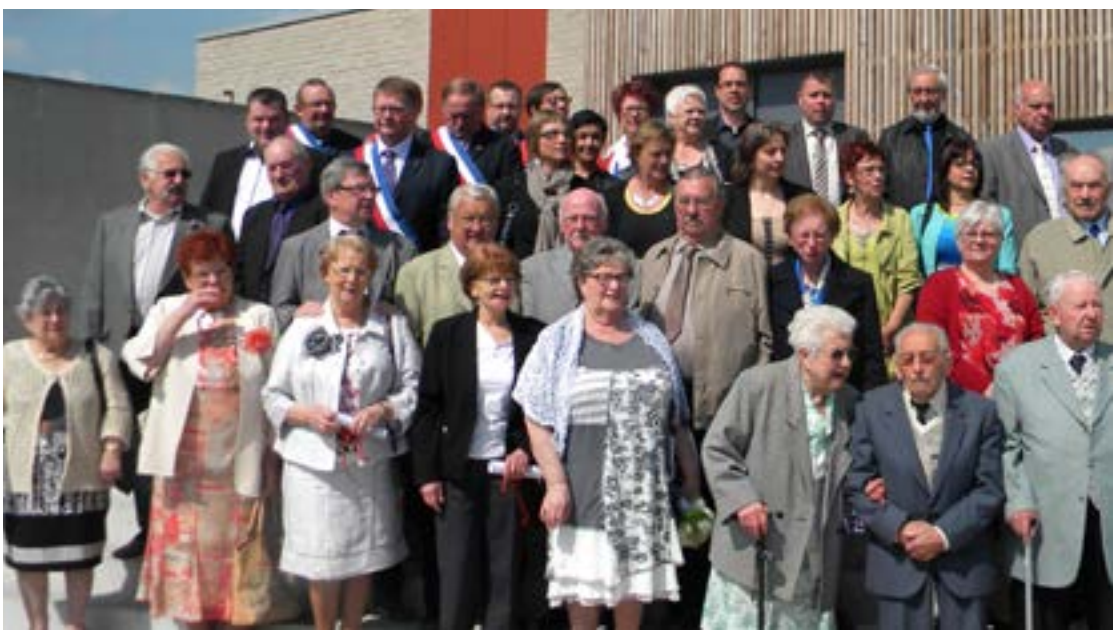
Juin Fête de la Commune