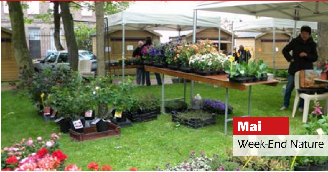
Mai Week-End Nature