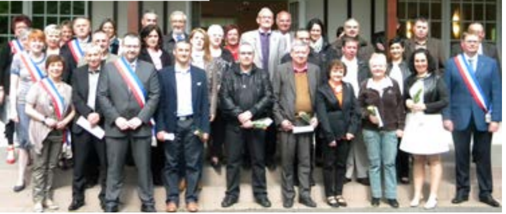
Mai Les Médailleurs du Travail