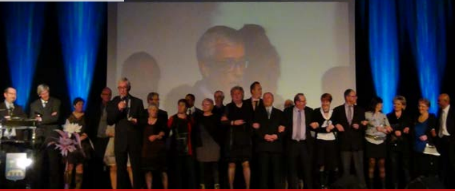
Janvier Cérémonie des Voeux