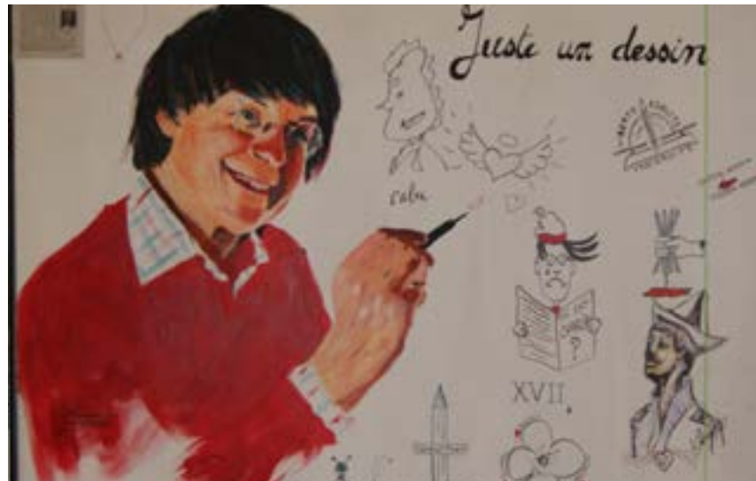
Le Salon a été marqué par l'Hommage à Cabu, dont la toile a été complétée tout au long du salon par les artistes, mais aussi par le public