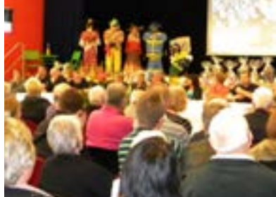
Octobre Récompense des maisons