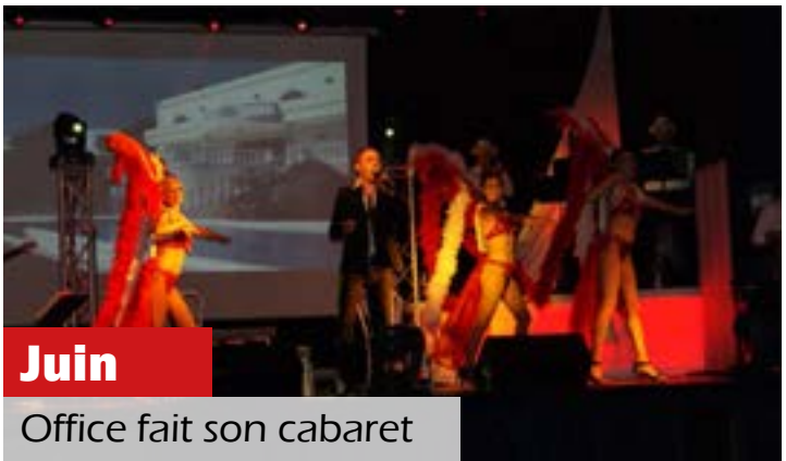
Juin Office fait son cabaret