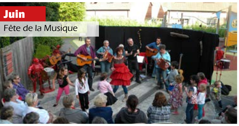
Juin Fête de la Musique