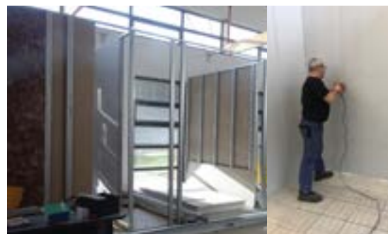
Les travaux de réaménagement des bureaux de l'Hôtel de Ville

Au plaisir de vous y rencontrer et d'échanger à son sujet ! A bientôt,