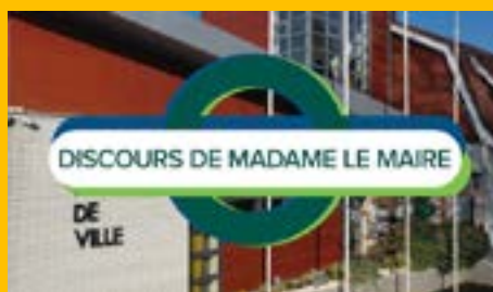
Voeux de Madame le Maire