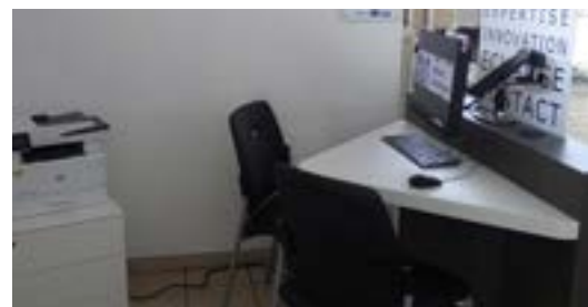
L'ilôt numérique pour vos démarches administratives.

La levée du courrier est maintenue dans un premier temps dans la boîte aux lettres sise rue Jean Jaurès, du lundi au jeudi à 14H30 et les vendredis et samedis à 11H30. Elle s'effectuera dans un second temps rue Henri Durre, à proximité immédiate du Parc Municipal Louis Delhaye.